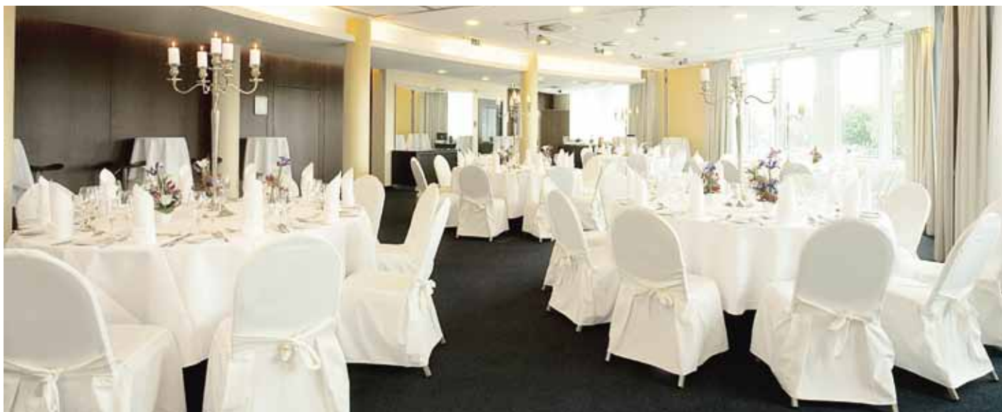
Salon Stencil Moonlight